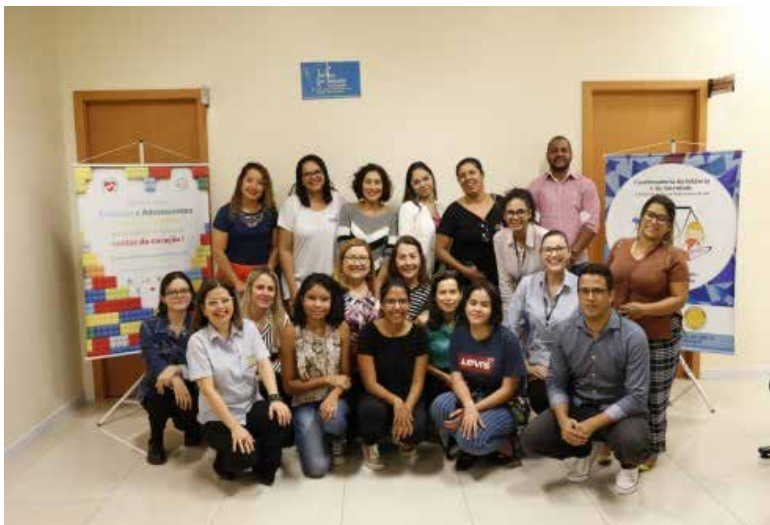
Voluntários capacitados pela CIJ em 2019

O Projeto “Minha História, Minha Vida” é uma parceria da Coordenadoria da Infância e da Juventude do TJMS com o Instituto Fazendo História, visando a proporcionar às crianças e adolescentes de instituições o resgate de sua história de vida, mediante interações lúdicas que envolvem leitura de livros e contação de histórias realizadas por voluntários previamente capacitados que visitam as crianças nas instituições de acolhimento uma vez por semana pelo período de uma hora. Os voluntários selecionados comprometem-se pelo prazo de um ano com cada entidade.