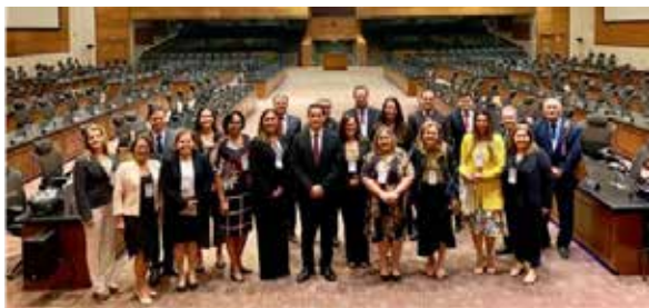
XIV Encontro do Colégio de Coordenadores da Infância e da Juventude – Rio de Janeiro – 03/05/2019

No XIV Encontro, realizado no Rio de Janeiro, foram discutidos temas como o Provimento n. 63 do CNJ, a autorização de viagem eletrônica por cartórios extrajudiciais, o contraditório no acolhimento, a audiência por videoconferência no sistema socioeducativo, a profissionalização e a saúde mental para adolescentes infratores.