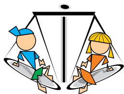
Coordenadoria da Infância e da Juventude Tribunal de Justiça de Mato Grosso do Sul