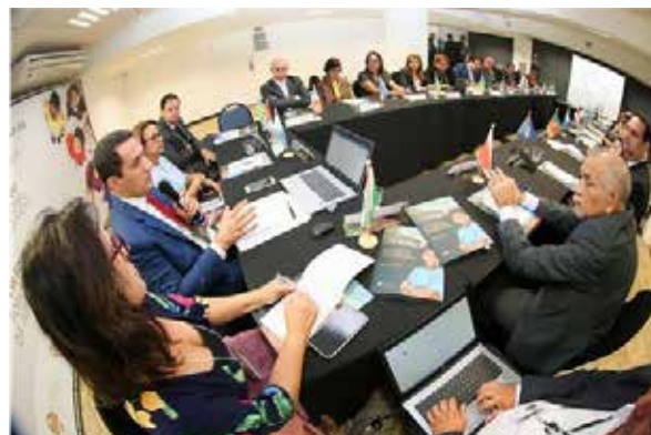
XIV Encontro do Colégio de Coordenadores da Infância e da Juventude – Maceió – 04/04/2019

em um mesmo local todas as instituições encarregadas do atendimento do público infanto-juvenil, com a integração desses órgãos, a fim de evitar que crianças e adolescentes e suas famílias tenham que percorrer uma série de locais para efetivação de seus direitos.